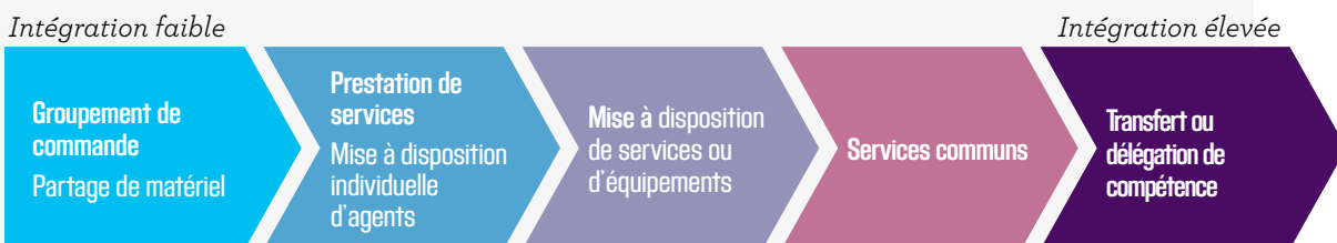
Fig.1 – Degrés de mutualisation de services

Le transfert de compétences constitue la forme la plus aboutie de «mutualisation de services», concept beaucoup plus vaste qui peut aller de la simple mise à disposition à des formes de coopération beaucoup plus poussées (ententes, mise en œuvre de services communs ou partagés...).